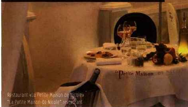
Restaurant «La Petite Maison de Nicole» "La Petite Maison de Nicole" restaurant