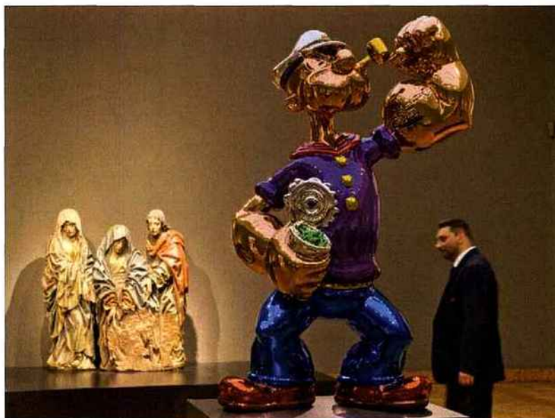
Popeye de Jeff Koons, Galerie Gagosian /

Who better than a Head Concierge to reveal a town's or district's secrets, places which shouldn't be missed and unexpected highlights? Nobody!